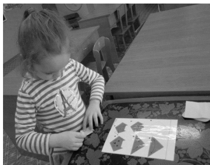
Рис. 1 Изготовление поделки по пооперационной схеме

На данном этапе реализованы следующие мероприятия: первичная диагностика уровня развития моторики и воображения детей среднего дошкольного возраста; методическая подготовка кадровых ресурсов через изучение литературы по изготовлению поделок в технике оригами; разработка перспективного тематического планирования; размещение методических рекомендаций для родителей на сайте детского сада; организация «Чудесной лаборатории», предполагающей проведение детских экспериментов и опытов с бумагой.