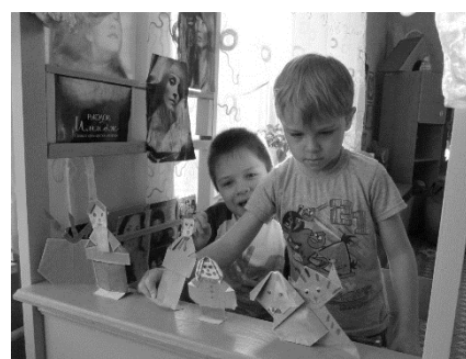
Рис. 3 Играем в настольный театр

Цель основного этапа - способствовать творческой самореализации дошкольников в изготовлении и использовании поделок в технике оригами.