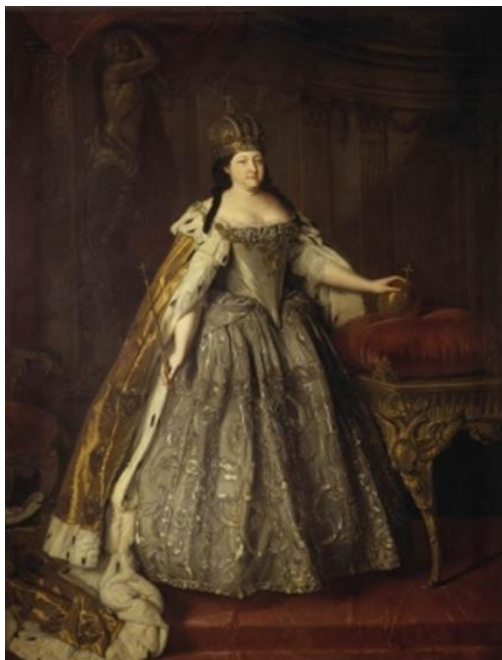
Рис. 1. Л. Каравак. «Портрет Императрицы Анны Иоанновны». 1730 г. (ГТГ) [11].

Краеугольной в императорском портрете, как в русском, так и в европейском, стала идея персонификации власти в личности правителя. Парадное изображение несло в себе обязательный набор атрибутов: пышный интерьер, регалии власти – корона, мантия, скипетр и т.д.