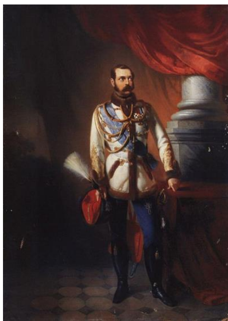
Рис. 4. Ф. Крюгер. «Портрет Александра II». 1840 г. (ГЭ) [25].

Замечательно и то, что некоторые характерные составляющие черты и композиционные приемы этой «схемы» используются художниками на протяжении 19 века. Примером могут служить парадные портреты Александра II работы Ф. Крюгера (1840г., ГЭ, рис. 4), К.Е. Маковского (Нижегородский музей, 1860 гг. рис. 5); портреты