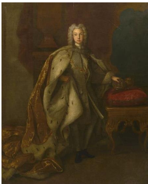
Рис. 2. И.П. Людден. «Портрет Петра II». 1725 г. (ГРМ) [12]

Любопытно, однако, что изображение каждого правителя, тем не менее, приобретает в рамках общей «схемы» свой оттенок, очевидно, возникающий под влиянием конкретного исторического периода и присущих ему художественных тенденций. Статичный, монументальный, замкнутый «в себе» образ Анны Иоанновны кисти Л. Каравакка (ГТГ, 1730 г. рис. 1) совмещает в себе характерные черты живописи европейского барокко и, что важно, в трактовке образа опирается на эстетику русского искусства предыдущей эпохи – царскую парсуну. В период правления Елизаветы Петровны портрет становится более «роскошным» (40 – 50 гг. 18 века): исчезает слишком темный колорит, заменяясь серебристыми тонами платья, блеском драгоценностей, пышными драпировками. Выделяется и подчеркивается красота лица императрицы, появляется изящность в фигуре и аксессуарах. Таким образом, на смену «статичности» появляется «внутреннее» движение в полотне. Портрет приобретает некоторые черты стиля рококо.