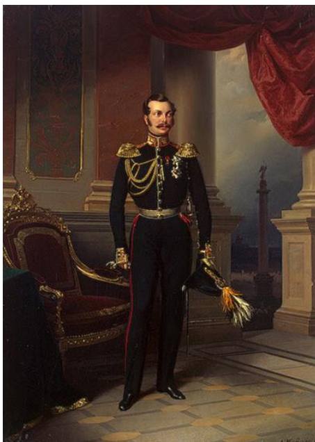
Рис. 5. К.Е. Маковский. «Портрет Александра II». 1860-е г. (Нижегородский государственный художественный музей). [26].

представлением монаршего лица в различных присутственных местах. В то же время применение официального канона не ограничивало творческий подход художника в трактовке образа императора.