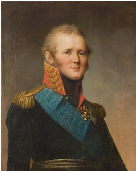
Рис. 14. В.Л. Боровиковский. «Портрет Александра I». 1802-1803 гг. (ГРМ) [21].

Примечательным явлением становится то, что и в императорском портрете этого периода проявляется вышеперечисленное стилистическое разнообразие, в результате чего изменяется и расширяется его типология и изобразительный язык. С одной стороны, сохраняется схема портрета-аллегии 18 века, насыщенного соответствующей атрибутикой: портреты Александра I кисти В.Л. Боровиковского (1802-1803 гг., ГРМ, ил. 14), Ж.Л. Монье (1806 г.). Аллегоризированное изображение императора вполне соответствовало и романтической концепции, и эстетике ампира.