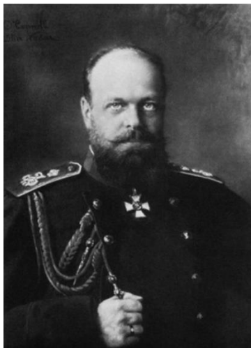
Рис. 21. Ф. Надар. «Портрет Александра III». 1896 г. [30].

Портреты Николая II являют нам отчетливое разделение изображений царствующей персоны на несколько абстрагированный, официальный образ – портрет парадный, условно обезличенный, каноничный по композиции и цветовому решению, и на портреты-картины, не вписывающиеся ни в какие до этого времени существовавшие рамки как парадного, так и камерного портрета.