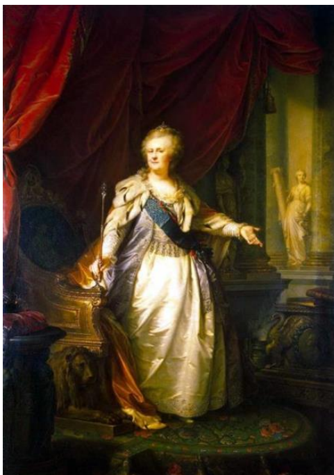
Рис. 8. И.-Б. Лампи Старший. «Екатерина II с аллегорическими фигурами». 1790-е гг. (Архангельский музей изобразительного искусства). [15].