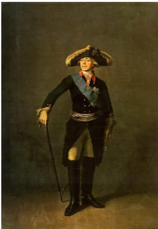
Рис. 13. С.С. Щукин. «Портрет Павла I». 1797. (ГРМ) [20].

Наиболее любопытен в этом ряду портрет кисти С.С. Щукина (ГРМ, 1797 г., ил. 13), где наглядно проявляются изменения, происходящие в концепции парадного портрета в целом и, косвенно, свидетельствуют об общественных идейных изменениях. По композиции и формату это парадный портрет. Но здесь происходит полное отступление от традиционной схемы. Это уже не парадный портрет 18 века, не портрет-аллегория. Павел I предстает перед зрителем в нейтральном пространстве. Художник изображает его на темно-оливковом фоне, без каких-либо дополнительных аксессуаров, не в царском облачении, а в форме полковника Преображенского полка, таким, как он предстал перед Двором и армией в первый день царствования. Отказ от аллегорических аксессуаров, необычный для 18 века лаконизм в решении полотна позволяет и художнику, и зрителю сконцентрироваться непосредственно на личности Императора, характерными чертами которого были самодостаточность, властность, и в то же время, склонность к самодисциплине и романтизм. Сознательно используя лаконичное решение в композиции, колорите Щукин достигает максимального визуального и психологического эффекта в прочтении образа. Портрет понравился Павлу I и был одобрен им, художник заслуженно получает звание академика. Многими исследователями этот портрет считается символом павловского времени.