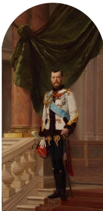
Рис. 6. Э.К. Лунгарт. «Портрет Николая II». 1890-е гг. (Царское Село) [31].

С 1780-х гг. – в период расцвета правления Екатерины II, с приходом стиля Классицизм императорский портрет приобретает новые черты. Происходит усложнение смысловой нагрузки полотна, которое повлекло за собой смещение акцентов в композиционном строе картины. Дух эпохи Просвещения привносит идею «идеального монарха», чьи качества воплощаются в реальном правителе – Екатерине II. В свою очередь живописи потребовались новые методы, приемы для визуального воплощения Идеи. Возникает новый вид парадного изображения – «портрет-аллегория». Композиция полотна наполняется дополнительными предметами, имеющими символическое