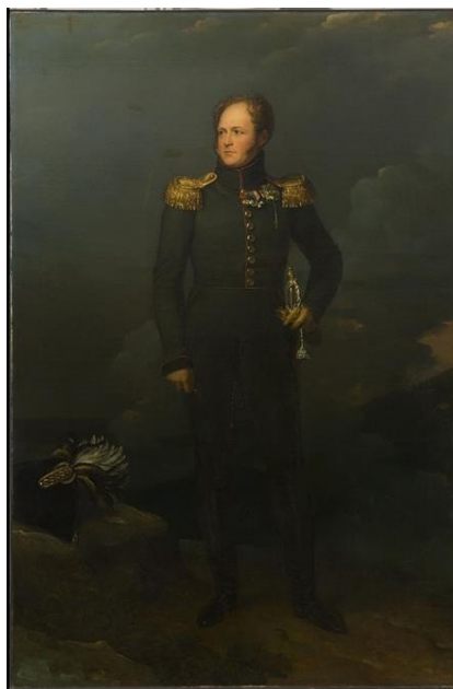
Рис. 16. Ф. Жерар. «Портрет Александра I». 1810-12 г. (ГЭ) [23].

Для парадного портрета этого времени характерны поиски методов передачи героического и возвышенного в человеке. Лучшими образцами «героического романтизма» становятся военные портреты: Императора Александра I кисти Ф. Жерара и Дж. Доу (собрания Эрмитажа и Русского музея, рис. 16, 17).