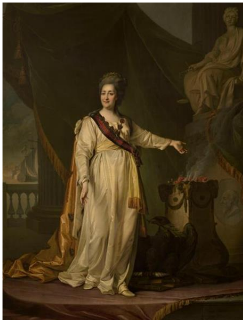
Рис. 7. Д.Г. Левицкий. «Екатерина II – законодательница в храме богини Правосудия». 1783 г. (ГРМ) [14].

значение, при их «прочтении» указывающие зрителю на качества портрируемого как Правителя и на его государственные деяния. В сравнении с ранними портретами Екатерины II, в которых главным было в большей степени «прославительное» начало, в период Классицизма на первый план выдвигается и становится главным повествовательность и поучительность. Портрет призван не только представлять монарха, но демонстрировать его качества идеального государственного деятеля. Лучшие примеры такого типа портрета «Екатерина II – Законодательница в храме богини Правосудия» и «Екатерина II – воительница-миротворица» кисти Д.Г. Левицкого (ГРМ, 1783 г., рис. 7) и «Екатерина II с аллегорическими фигурами» И.-Б. Лампи Старшего (Архангельский музей, 1790-е гг., рис. 8). Содержательная составляющая этих двух портретов индивидуальна и показана в каждом из полотен необходимой для прочтения образа символикой. Более того все это дополняется текстовой Программой, трактующей аллегории.