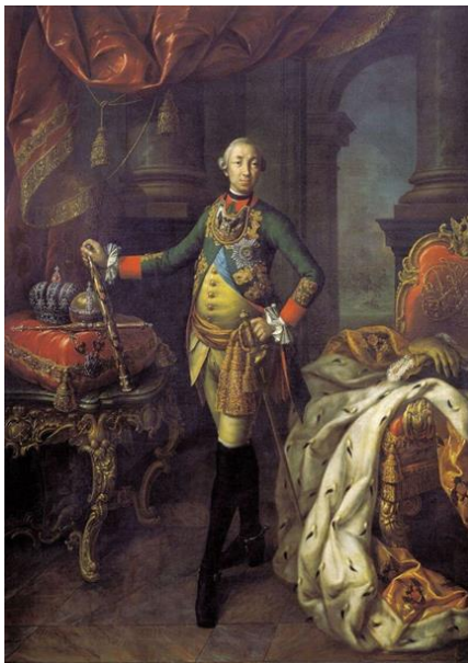
Рис. 3. А.П. Антропов. «Портрет Петра III». 1762 г. (ГРМ) [13].

Репрезентативная схема устойчиво сохраняется и наглядно проявляется в портретах Анны Леопольдовны, Петра II (ГРМ, 1725 г., ил. 2), Петра III (ГРМ, 1762 г., рис. 3), что вполне объяснимо, т.к. соответствует и духу эпохи и последовательности развития художественных стилей на протяжении 18 века.