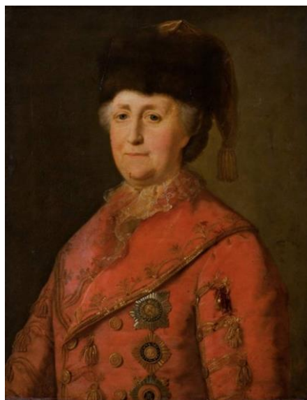
Рис. 10. М. Шибанов. «Екатерина II в дорожном костюме». 1787 г. (ГРМ). [17].