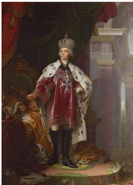
Рис. 11. В.Л. Боровиковский. «Портрет Павла I». 1800 г. (ГРМ) [18].

Рассмотренные же выше два портрета еще раз косвенно свидетельствуют о внимании и интересе императрицы к национальным традициям, которые после петровских реформ значительное время находились вне сферы внимания высших слоев общества. Эти шаги к русскому, национальному последующими императорами были продолжены. В первой трети 19 века закладываются основы «Русского стиля», расцвет которого произойдет во второй половине 19 века, когда он будет провозглашен официальной государственной программой. Повествовательные аллегории и парадная репрезентативность равноправно существуют еще значительное время: это и портреты Павла I со знаком мальтийского ордена (кисти В.Л. Боровиковского, С. Тончи ил. 11, 12, оба в коллекции Русского музея), первые портреты Александра I.