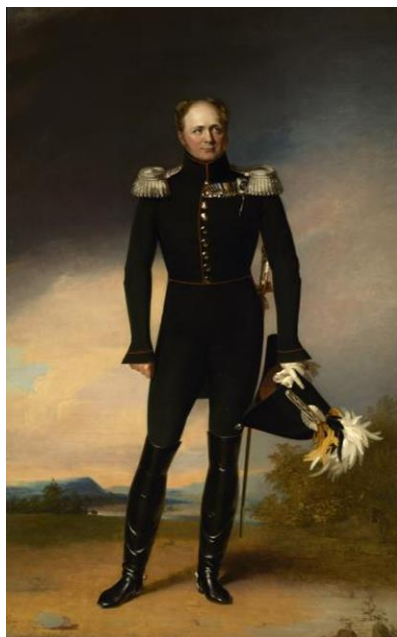
Рис. 17. Дж. Доу. «Портрет Александра I». 1825 г. (ГРМ) [24].

Изучая портретную живопись середины 19 века по изменению стилистики парадного императорского портрета можем отчетливо наблюдать и изменения в духе правления, курсе развития страны и настроений общества. Трансформация образов идет от романтизированных, в какой-то