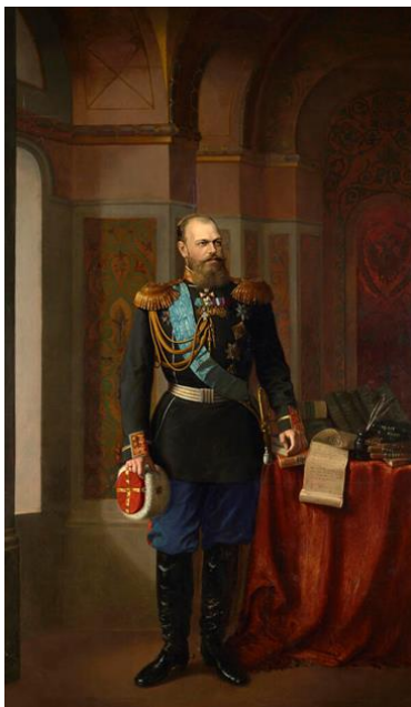
Рис. 20. И.Н. Крамской. «Портрет Александра III». 1886 г. (ГРМ) [29].

Портретный ряд Александра III, с одной стороны, повторяет стилистику предшествующих картин. Но это только на первый взгляд. Изображения императора последовательно декларируют «русскую идею», лидера, создают образ русского царя, радеющего заботой о своем народе самодержца, главы огромной, мощной Русской империи. И подтверждением этому является провозглашенная идея того времени «Православие, Самодержавие, Народность».