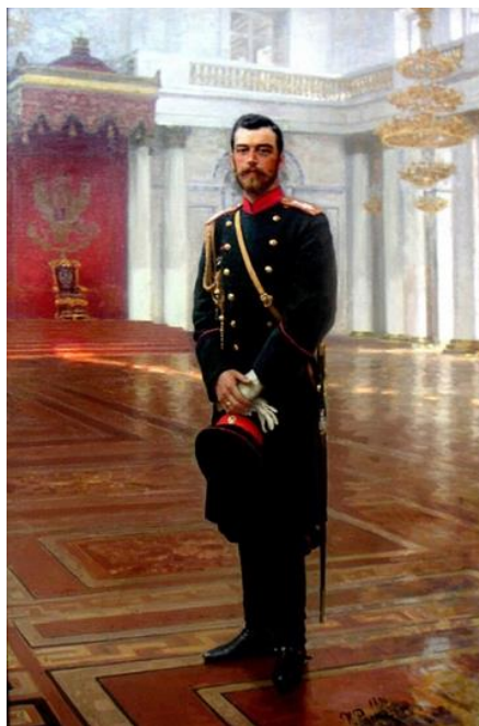
Рис. 22. И.Е. Репин. «Портрет Николая II». 1896г. (ГРМ). [32].

В это же время написаны портреты И.Е. Репиным, В.А. Серовым, Б.М. Кустодиевым (рис. 22, 23, 24). В этом круге портретов мы видим остро-индивидуальное восприятие каждым художником личности императора, воплощение в создаваемом образе тех смыслов, идей, надежд, которые были присущи и самим художникам, и транслировались ими как «концентрат» настроений общества. Возможно, именно потому, что, несмотря на все сложности и противоречия эпохи рубежа конца 19-начала 20 века, в личности и образе императора общество видело и самодержца, и воплощение национальной идеи, и объединяющую все социальные слои фигуру портреты кисти И. Е. Репина (в тронном зале, где Николай II несомненно – самодержец), камерный портрет В.А. Серова (глядя на который зритель вступает в непосредственный, личный диалог с изображенным) и почти «народный», портрет Б.М. Кустодиева (на фоне Кремлевских соборов) органично вписываются с в контекст истории. И что примечательно, все эти портреты благосклонно приняты и самими венценосными заказчиками, и обществом.