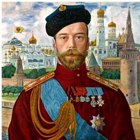
Рис. 24. Б.М. Кустодиев. «Портрет Николая II». 1915 г. (ГРМ) [34].