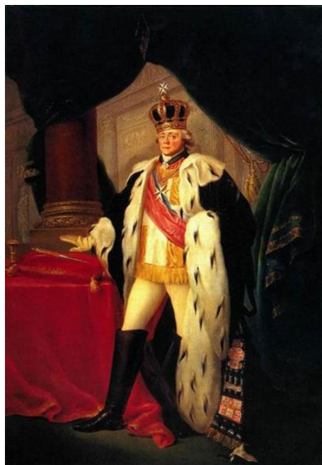
Рис. 12. С. Тончи. «Портрет Павла I». 1798-1801 гг. (ГРМ) [19].