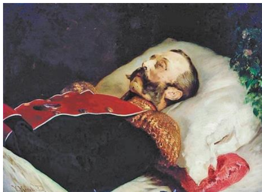
Рис. 19. Маковский. «Портрет Александра II». 1881 г. (ГТГ) [28].

Отдельно в ряду выделим последний портрет императора, работы так же К. Маковского, написанный с натуры и абсолютно трагичный - «Александр II на смертном одре» (рис. 19, 1881 г., ГТГ).