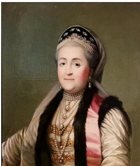
Рис. 9. В. Эриксен. «Портрет Екатерины II в шугае и кокошнике». 1770-е гг. (ГЭ) [16].

Обращаясь к истории развития императорского портрета и исследуя пути его становления, заметим, что в период правления Екатерины II закладываются основы для еще одного типа изображения монарха, который получит развитие далее в 19 веке. Речь идет о двух портретах императрицы, написанных в разное время: «Екатерина II в шугае и кокошнике» кисти В. Эриксона (ГРМ, 1772 г., рис. 9) и «Екатерина II в дорожном костюме» (ГЭ, 1787г., рис. 10), художник М. Шибанов. Прежде всего, это портреты небольшого формата (поясное изображение), это и не вышерассмотренная «аллегория». В них мы видим императрицу без царских регалий и вне традиционного дворцового интерьера. Одним из интересных моментов присущих этим портретам является то, что Екатерина изображена у В. Эриксона в русском платье (шугай, кокошник, платье, украшенное жемчугом), а у Шибанова в дорожном костюме, по сути, являющимся русским кафтаном. Выбор костюмов императрицей очевидно не случаен. История подтверждает, что уже предшественница Екатерины, Елизавета Петровна проявляла интерес к русскому. Сама Екатерина утверждает форму придворного платья в русском стиле.