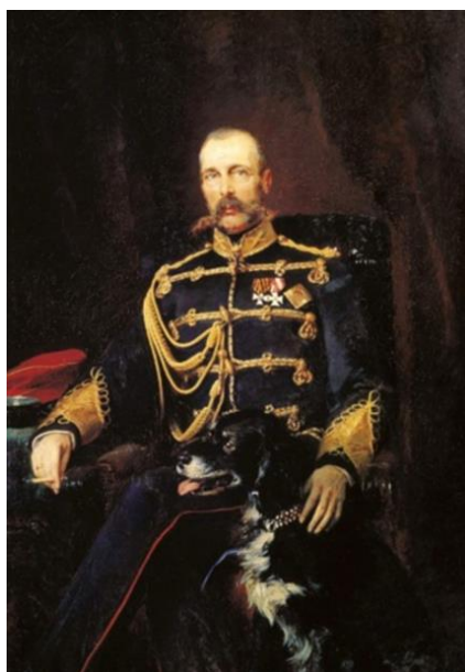
Рис. 18. К.Е. Маковский. «Портрет Александра II». 1881 г. (ГТГ). [27].

Ярчайшим примером этих новых веяний является портрет кисти К. Маковского: «Портрет Александра II» (1881 г, ГТГ, рис. 18).