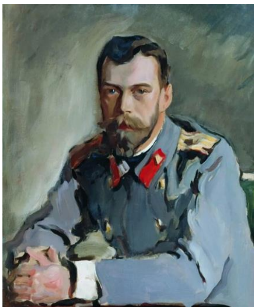
Рис. 23. В.А. Серов. «Портрет Николая II». 1900 г. (ГТГ) [33].